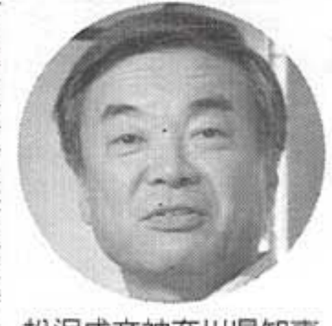
松沢成文神奈川県知事