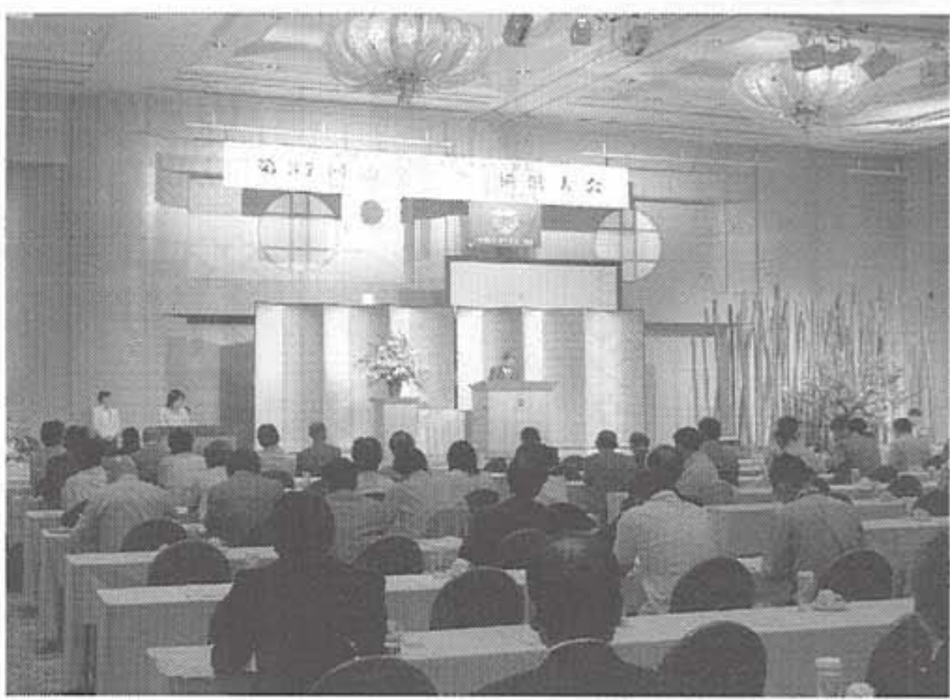
インドア・グリーン協会の通常総会・横浜大会