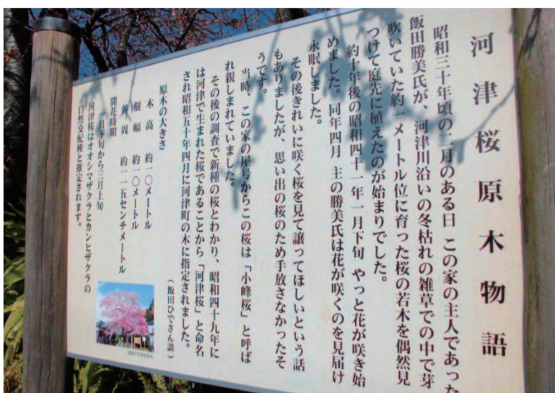
原木の説明板。河津桜の生い立ちがよくわかるので、どうぞお読みください