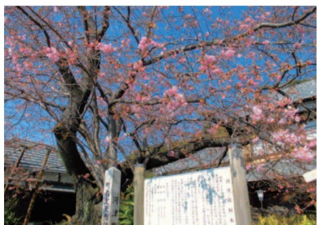
飯田家所有、河津桜の原木。樹齢60年以上、高さは10m。