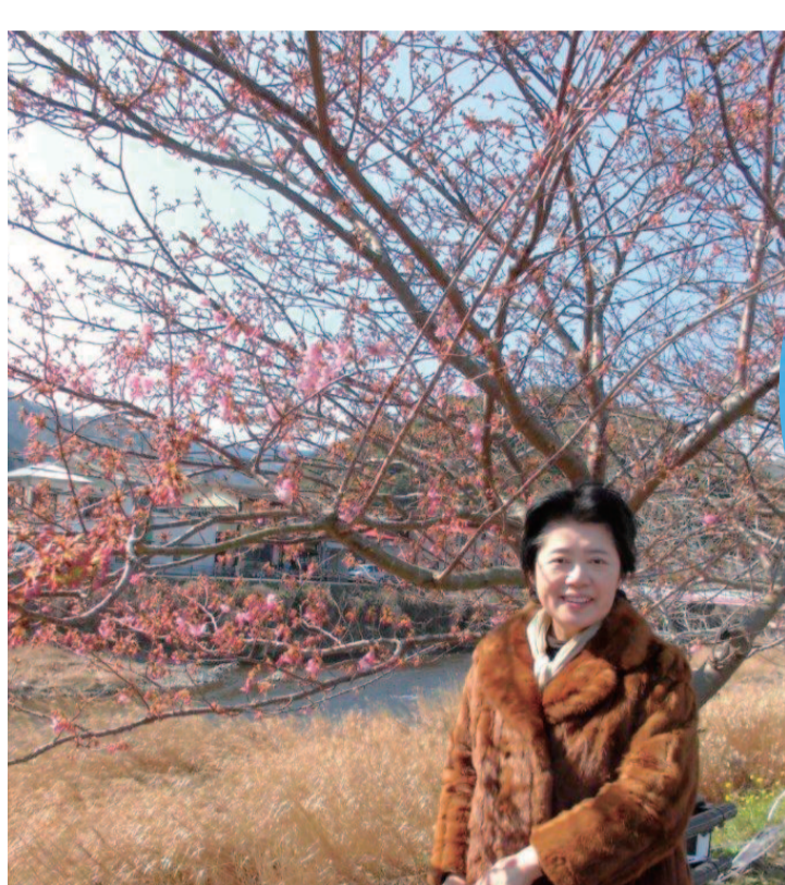
河津桜の名所、河津川のほとりにて