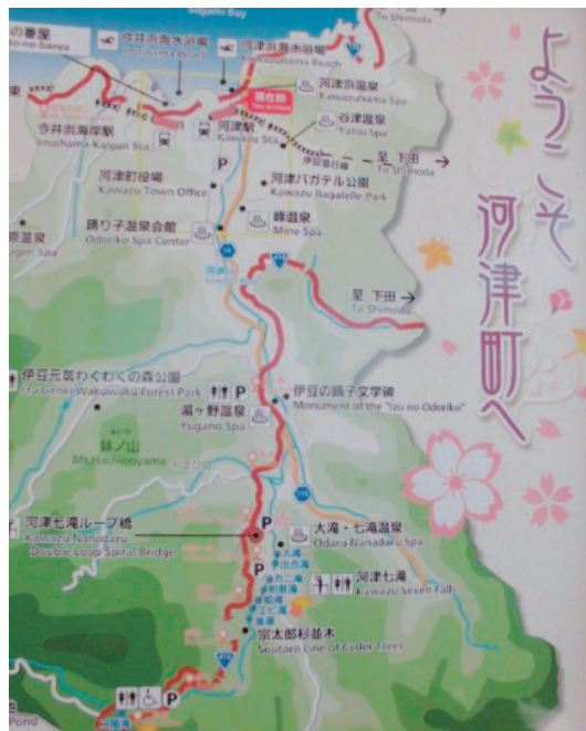
河津駅を下りるとすぐに、町の案内版。見どころいっぱい、魅力いっぱいの河津町。

静岡県伊豆半島の河津町。おなじみの河津桜だけでなく、まだ市販されていないカーネーションの数々や国の天然記念物に指定されている大楠、大ソテツなど、植物の見どころいっぱい。晴天のもと、早春の香りを楽しむ一日となりました。