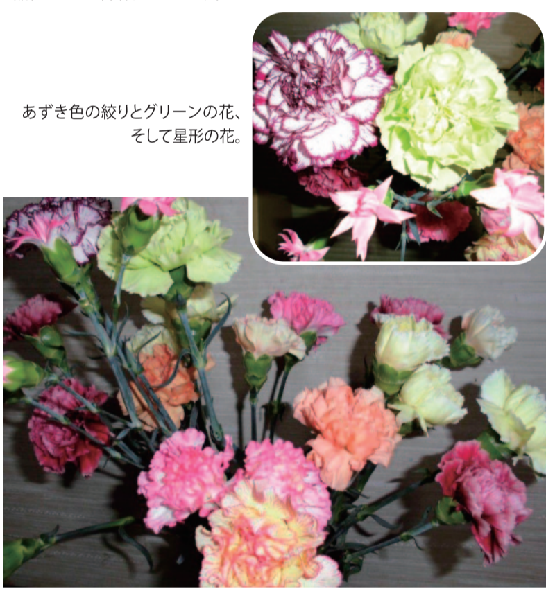
あずき色の絞りとグリーンの花、そして星形の花。