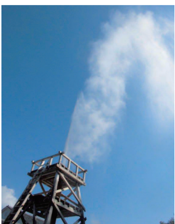
いで湯の里としても知られる河津。町内にある7つの温泉郷の一つ、峰温泉の大噴湯公園。青空に向かってお湯が吹き上がる様は圧巻!!