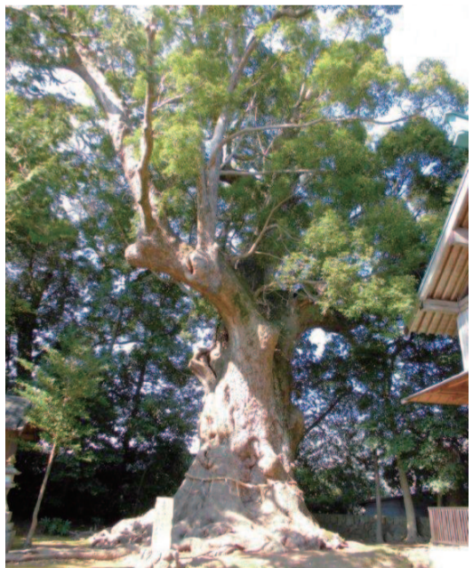
河津来宮神社にそびえる国指定天然記念物の大楠。樹齢は推定1000年以上。