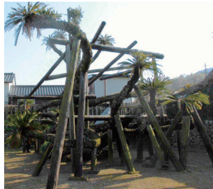
こちらも国指定天然記念物。峰温泉近くにある新町の大ソテツ。樹齢はやはり1000年以上と推定。