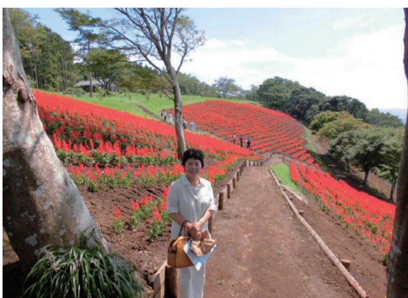
宇多氏の写真の後ろに見えていたサルビアの咲く花の大斜面・東に到着。30万本が色鮮やかに。見ごろは10月中旬まで。