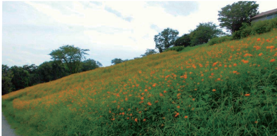
花の斜面・西には黄花コスモス、300万本。見ごろは9月中旬まで。