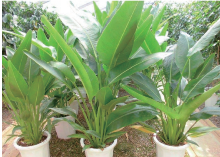
屋内緑化の植物たちは温室の中。イマキ園芸のコンセプトは少量多品目。これは温室内で出荷を待つタビトノキ、緑が美しい!