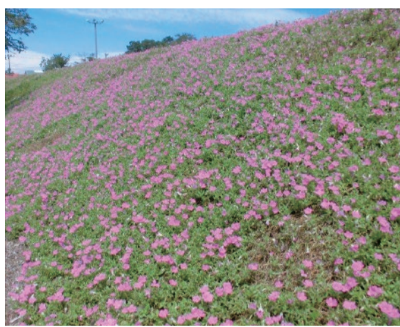
花の谷に咲く3万5千株のペチュニア、その名も桃色吐息。前日までの雨で、この日は少し控えめな咲き方ですが、晴天が続くと、緑の葉が全く見えないほど、一面濃いピンクのじゅうたんを敷き詰めたようになるんですよ。見ごろはサルビアと同じ10月中旬まで。