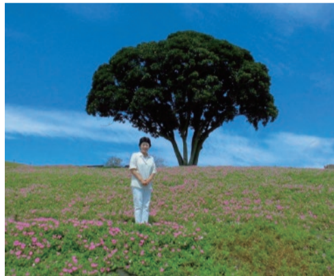
花の谷に下りる稜線に立つマテバシイの木。雨上がりの澄んだ青空が、マザー牧場のロケーションの魅力を一層輝かせる!!